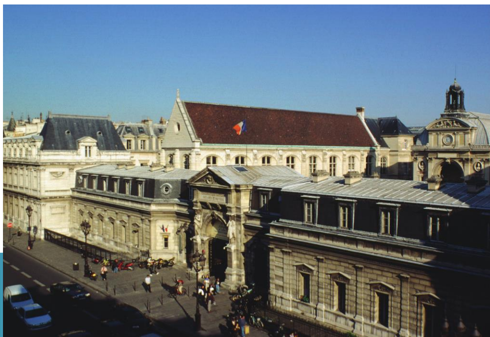
Dircom Cnam - BP/LL - Mai 2021

Responsable (nationale et opérationnelle) de la licence Isabelle Barbet, maîtresse de conférences isabelle.barbet@lecnam.net